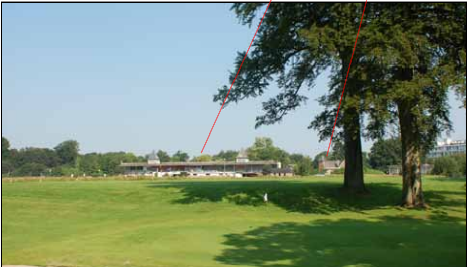
De geklasseerde grote tribune en de weeginstallatie tijdens de restauratie

gebouwen (tribune, weeginstallatie) geschat op minstens 6 mi € dient rendabel te zijn; dat enkel kan bereikt worden mits intensieve bezoeken en... ernstige verkeersstoornissen. Toen hebben de gemeenten Ukkel en Watermaal-Bosvoorde hevig verzet aangetekend en we verwachten dat ze dus ook zo opnieuw zullen reageren. Daarna heeft de Brusselse regering de op-